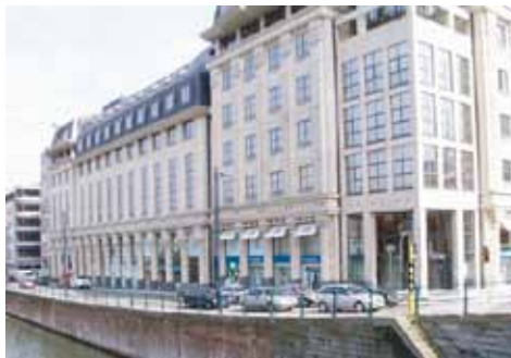
Aan de linkerzijde van het shoppingcenter ligt de Kuiperskaai, waar u de ingang tot onze kantoren vindt. (Kuiperskaai 55E, derde verdieping)