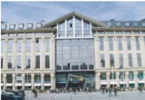
De hoofdingang van het Zuid Shopping Center