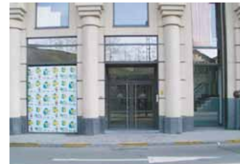
Onderstaande deur biedt u toegang tot onze kantoren.

Nadat u aangebeld heeft (Vakgroep Accountancy en Bedrijfsfinanciering) neemt u de lift naar de derde verdieping.